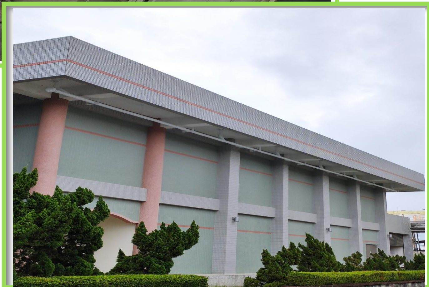
收集廠區屋頂雨水